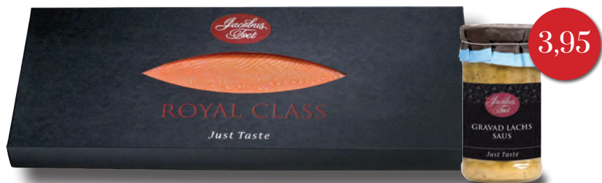
Jacobus Toet Gravad Lachs Saus

Gebruik de bestellijst of bestel direct op 070 346 23 00, raf@slagerijdungelmann.nl